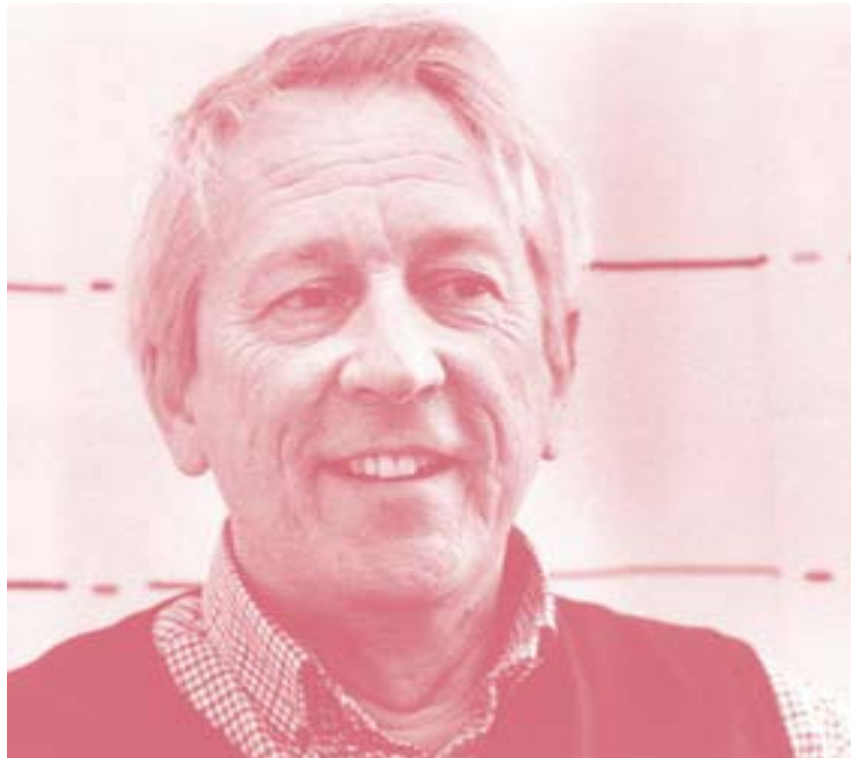
Tomas Tranströmer arbetade som psykolog på Ami i Västerås under många år. Bilderna togs 1998 i samband med ett reportage i Psykologtidningen .

tryck. I dikten Långsam musik skriver Tranströmer i första strofen: