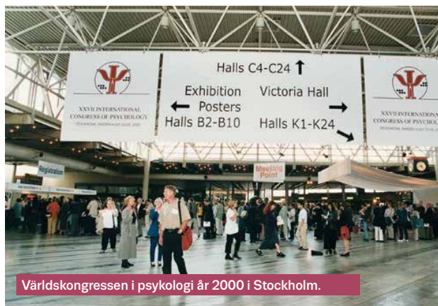
Världskongressen i psykologi år 2000 i Stockholm.

Ett tecken på en förändrad syn på psykologin och psykologisk behandling kanske även kan spåras i utvecklingen inom den slutna psykiatrin. Det förs fram allt fler önskemål om fler psykologer inom slutenspsykiatrin, och Psykologförbundet träffar sedan en tid regelbundet företrädare för Svenska Psykiatriska Föreningen i den frågan. Den så kallade sektoriseringen inom slutenspsykiatrin från början av 1980-talet och