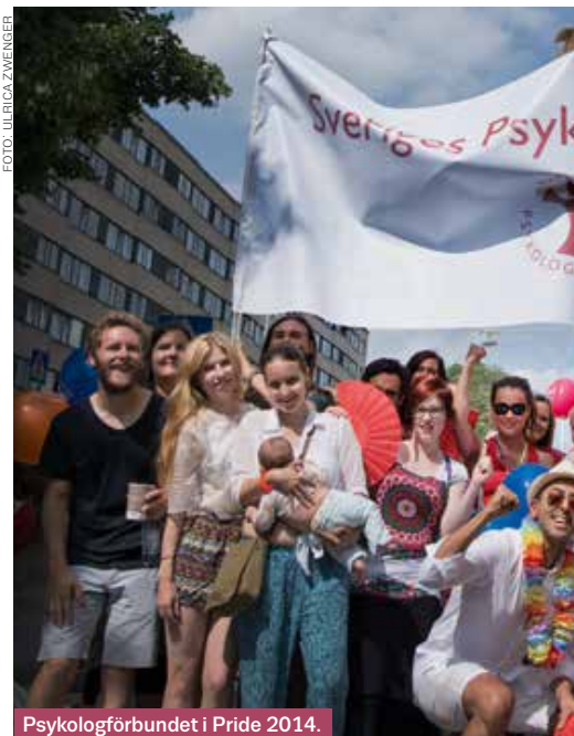
Psykologförbundet i Pride 2014.

– Världskongressen blev också startpunkten för att föra in psykologin i massmedierna, bevakningen var massiv och massmediernas intresse för psykologi har efter det hållit i sig och