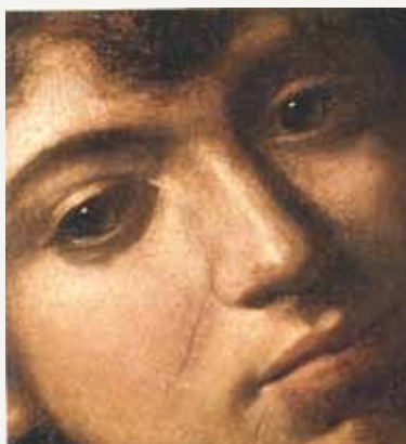
Johannes döparen av Caravaggio 1609 (detalj).