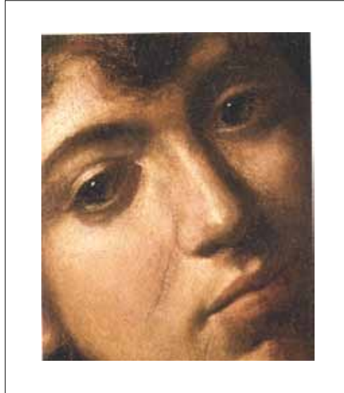
Johannes döparen av Caravaggio 1609 (detalj).